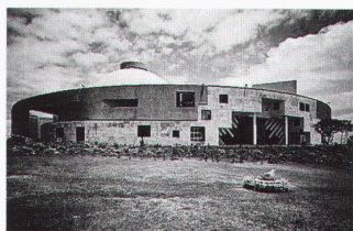
Charles Correa: Vidhan Bhavan, Bhopal

in Riad, entstanden 1985 in Zusammenarbeit vom Atelier Frei Otto und von dem Büro Happold, Omrania; dem 1992 von Nayyar Ali Dada projektierten Kulturzentrum Alhamra in Lahore sowie Charles Correa für sein 1993 in Bhopal, Indien, gebautes Regierungsgebäude Vidhan Bhavan.