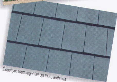
Ziegeltyp: Glattziegel GP 36 Plus, anthrazit

Das Prädikat wertvoll für Objekt und Material. Der elegante Glattziegel GP 36 Plus der Keller AG Ziegeleien für einheimische Qualität in der Architektur.