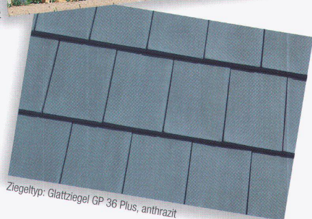
Ziegeltyp: Glattziegel GP 36 Plus, anthrazit

Das Prädikat wertvoll für Objekt und Material. Der elegante Glattziegel GP 36 Plus der Keller AG Ziegeleien für einheimische Qualität in der Architektur.