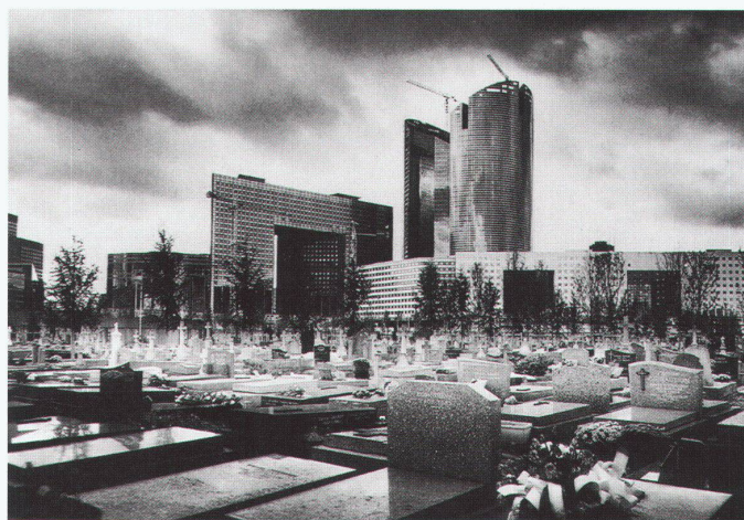
Paris Nanterre 1995

Zum drittenmal vergibt die «deutsche bauzeitung» einen Preis für Europäische Architektur fotografie. Nach den Themen «Mensch und Architektur» vor drei Jahren und «Architektur schwarzweiss» 1997 steht ein weiterer wichtiger Aspekt der Architektur fotografie im Mittelpunkt: die Frage nach dem Ort, der Umgebung eines Gebäudes. Gezeigt werden soll, ob und wie die Umgebung ein Gebäude geprägt hat. Wurde auf