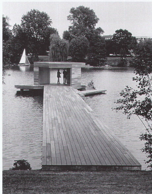
Pier , Arbeit von Jorge Pardo anlässlich von «Skulptur. Projekte», Münster (1997) ▷ Pier , travail de Jorge Pardo dans le cadre de «Sculpture. Projets», Münster (1997) ▷ Pier , a work by Jorge Pardo created for "Sculpture. Projects", Münster (1997).

appended detachable, semi-circular templates which serve as a base. Depending on the expectations of the recipient, the book may oscillate between a sculpture, an art book and a catalogue, at the same time opening up separately conceived, juxtaposed and counterbalancing areas of meaning such as sculpture – basic commodities, autonomy – function, and artistic authorship – teamwork.