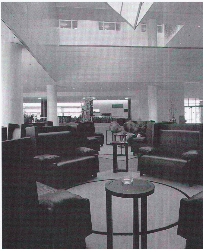
Lobby mit gewichtigen Sesselarchitekturen ▷ Lobby avec architectures de sièges massives

Das um einen verglasten Innenhof errichtete Grand Hyatt präsentiert sich gemäss debis-Gestaltungsplan als Berliner Blockrandbebauung mit steinernen Fassaden. Der Bau wirkt ruhig, geradezu introvertiert. Die durch den Sandstein implizierte Ortsbezogenheit kommt der vom Hyatt-Konzern angestrebten lokalen Verankerung seiner Bauten sehr entgegen. Auch im komplexen Kunstkonzept von Wettsteins Team wird diesem Anspruch Rechnung getragen. Neben Werken internationaler Kunstschafter stellen solche lokaler Künstler sowie Fotografien aus dem Bauhaus-Archiv den Bezug zu Berlin her. Dabei nimmt Wettstein Moneos Dialektik von Schlichtheit und Komplexität in der Innengestaltung auf und entwickelt sie in einem verwandten Ansatz weiter.