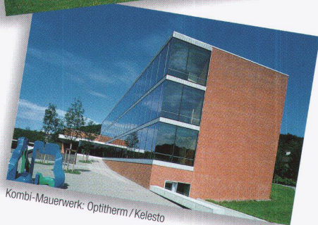
Kombi-Mauerwerk: Optitherm / Kelesto

Das Prädikat wertvoll für Objekt und Material. Die Kelesto-Linie der Keller AG Ziegeleien für innovative Architektur in Sichtstein und Klinker.