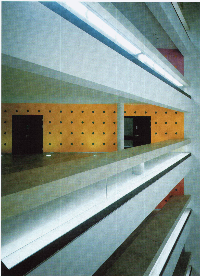
Wandmalerei von John Armleder