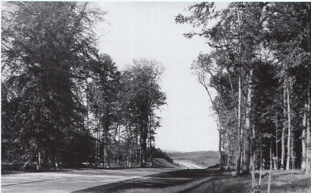
Reichsautobahn Frankfurt–Köln «im Buchenwald des Taunus mit schönem Bestand auf dem verbreiterten Mittelstreifen»