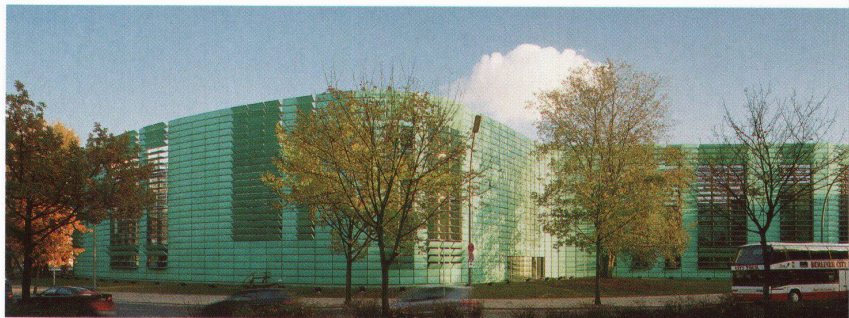
Objekt Nordische Botschaften, Berlin Architekten Berger + Parkkinen, Wien

TECU ® -Patina – natürlich patinierte Kupferprodukte mit allen positiven Eigenschaften von klassischem Kupfer. Für Dächer, Fassaden und Innenbereiche.