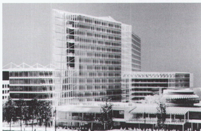
Büro- und Geschäftshaus Kranzler Eck, Architekten: Murphy/Jahn, Helmut Jahn, Chicago, 1998–1999

Das Café war 1825 vom österreichischen Zuckerbäcker Johann Georg Kranzler Unter den Linden gegründet worden und brannte in einer Bombennacht des Zweiten Weltkrieges vollständig nieder. Die Filiale am Kurfürstendamm besteht seit 1932. Das «Kranzler» vermochte – insbesondere auch den Touristen – bis zuletzt die Atmosphäre eines mondänes bescheidenen Nachkriegs-Berlin zu vermitteln. c.z.