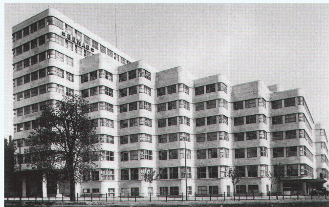
Shell-Haus, Berlin, 1930/31. Architekt: Emil Fahrenkamp, Düsseldorf

Die obere Ebene der einst zweigeschossigen Garage dient heute als Betriebsrestaurant. Über den alten