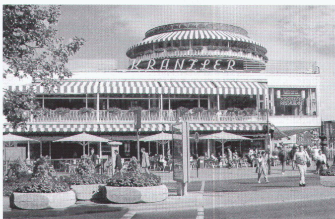
Das legendäre Café Kranzler am Berliner Kurfürstendamm

Büro- und Geschäftshaus Kranzler Eck gleichsam in die Zange genommen. Der grössere der beiden neuen Gebäudekörper aus Stahl und Glas ist über 50 m hoch und läuft an der Schmalseite, am Kurfürstendamm, zu einem spitzen Winkel zusammen.