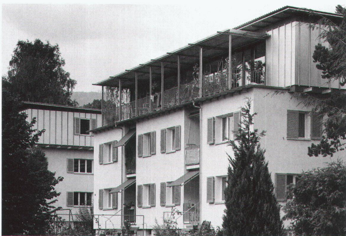
Siedlung «Obere Hofmatt», Solothurn, Aufstockung und Sanierung, Architekt: Jürg Stäuble, Solothurn.