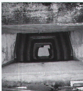
Bunker Altmatt 3, Rothenthurm SZ, 7,5 cm Kanone-Schartentopf

Im Kanton Schwyz gibt es mehrere Hundert ausgebaute Waffenstellungen, Bunker und unterirdische Werke. Die neu gegründete Stiftung Schwyzer Festungswerke will eine repräsentative Zahl von 10 bis 15 Werken, verteilt auf den ganzen Kanton, übernehmen, um sie als militärisches Kulturgut zu erhalten, sie Wissenschaft und Öffentlichkeit zugänglich zu machen, und das dafür notwendige Grundeigentum erwerben. c.z.