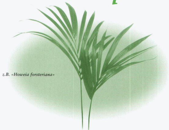
z.B. «Howeia forsteriana»