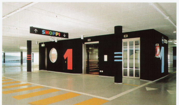
Gedekte Fussgängerpassage zwischen Parkhaus und Shopping- center (links)