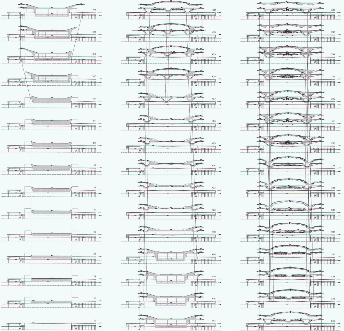
Querschnitt-Sequenzen im Fährterminal Yokohama (Architekten: Foreign Office Architects)