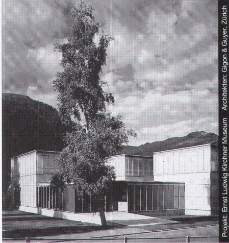
Projekt: Ernst Ludwig Kirchner Museum Architektin: Gigon & Guyer, Zürich

Ästhetik, Wirtschaftlichkeit und bauphysikalische Anforderungen in Einklang zu bringen, ist das Ergebnis ausgereifter Konstruktionen. Qualitätsbewusstsein und partnerschaftliche Zusammenarbeit sind nur einige der Voraussetzungen für ein gutes Gelingen in dieser vielfältigen Branche. Wir informieren Sie gerne kompetent und ausfühlich.