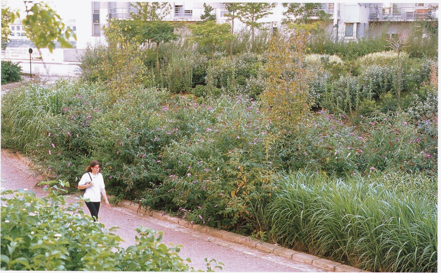
Christophe Girod: Parc Jules Guesde, Alfortville, 2000. – Bilder: Architekten

last but not least wurden die zentralen Voraussetzungen für die Entwicklung einer neuen Art von urbaner Landschaft in den vergangenen Jahren nicht geschaffen; denn wir lassen uns noch immer von den idyllischen Vorstellungen eines pastoralen urbanen Modells vergangener Zeiten ködern. Warum gelingt es uns nicht, Landschaftsmodelle zu entwickeln, die spezifisch unserer aktuellen «Agglo-Natur» angepasst sind? Ich denke an Modelle, deren radikal neue Form und Organisation von Natur die Schaffung lebensfähiger und dauerhafter Landschaftsstrukturen für die Stadt ermöglichen. In seinem Text «Die Natur der Stadt» betont Dieter Kienast: «Dass verdichtete Stadt nicht gleichzeitig Verlust an Lebensqualität, sondern deren Steigerung bedeuten kann, muss Aufgabe und Ziel aller am Stadtprojekt Beteiligten sein.» 2