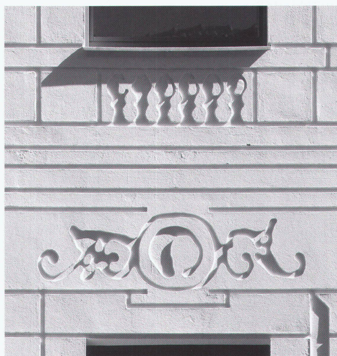
Fassadensanierung in Berlin, 1999

Die stuckierte Fassade des Gründerzeithauses existierte nur noch in Form der Originalzeichnung 1:100. Deren vergrößerte Nachbildung im Relief des neuen Putzes führte zu Verformungen und Verschiebungen, da das Haus nicht deckungsgleich mit der Zeichnung errichtet worden war. Das Ergebnis nimmt eine Position zwischen historischer Rekonstruktion und freier Interpretation ein. So wird die immer vorhandene Abweichung zwischen originalem Entwurf und Bauwerk zum Thema der Erneuerung.