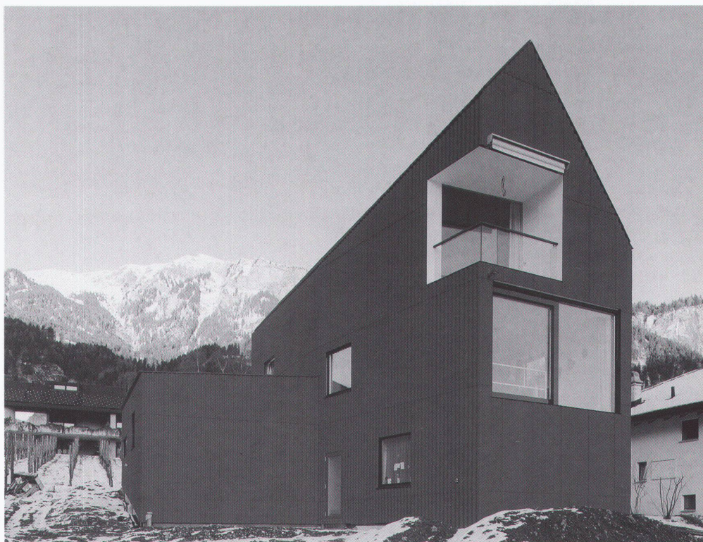
Wohnhaus in Malans, Architekten Bearth & Deplazes Chur, 2001–2002

In der Mitte des Buches sind, vorwiegend in schwarz-weiss, die vier firmeneigenen Verwaltungs- und Produktionsbauten von Otto Glaus, Thomas Schmid, Haefeli/Moser/Steiger und Paul Waltenspühl in Niederurnen und Payerne dokumentiert. Das Eternit der Gegenwart tritt am Schluss des Buches in Szene, wo Designobjekte aus den 50er und 90er Jahren und 45 dokumentierte Bauten mit Schindeln, Platten und Wellprofilen ein vielfältiges Bild bieten. Die Eternit AG scheint ihren gegenwärtigen Absatz vor allem