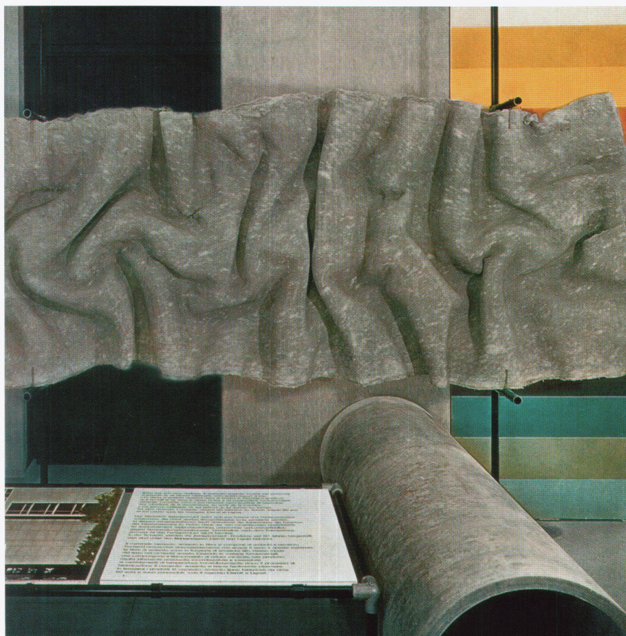
Experimentelle Eternit-Verformung an der Expo 64

Zusammenarbeit mit Architektinnen und Architekten hat die Firma eine eigentliche «Eternitkultur» entwickelt. Ein farben- und formenfrohes Spektrum von Fassadenverkleidungen für Wohn-, Agrar-, Industrie- und Schulbauten, die allgegenwärtigen Blumenkistli und der eleganteste Stuhl des Schweizer Design (die Sitzschlaufe von Willy Guhl) beweisen: Nach 100 Jahren haben die Schweizerischen Eternit-Werke, heute Eternit AG im Besitz der Holcim Unternehmensgruppe, Schweizer Geschichte geschrieben. Aus gegenwärtiger Sicht allerdings wirken die Blumentöpfe gewöhnlich, die Guhl-Schlaufe, die nach dem Asbeststopp aus Stabilitätsgründen modifiziert werden musste, nostalgisch, und die Möbel der neuen Serie als Kompromiss. Schliesslich unterrichtet die ETH Zürich Architektur und nicht Design: Also haben die Ausstellungsmacher das Hauptgewicht auf die Bauten gelegt. In grossformatigen Fotografien werden die Fassaden von vier Gebäuden, für die die Eternit AG als Bauherrin agierte, und von 45 Häusern, für die Eternit verwendet wurde, in ihrem heutigen Zustand gezeigt.