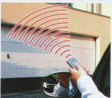
Ein Hörmann Antrieb bietet Ihnen noch mehr Komfort