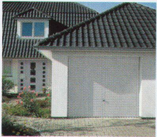
Berry Kipptore: Stahl oder Holz in 20 schönen Motiven