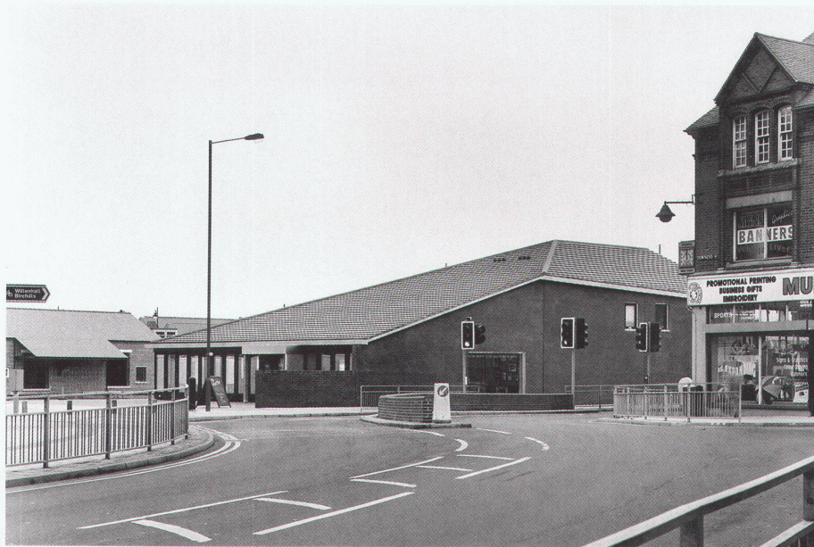
Sergison Bates, Pub im Walsall

Bauherrschaft: Stadtwerke Hall in Tirol GmbH Planung: henke und schrieck Architekten, Wien Baumanagement: BMO Baumanagement, Hall in Tirol Wettbewerb: 2001 Ausführung: Januar 2002 bis Mai 2003