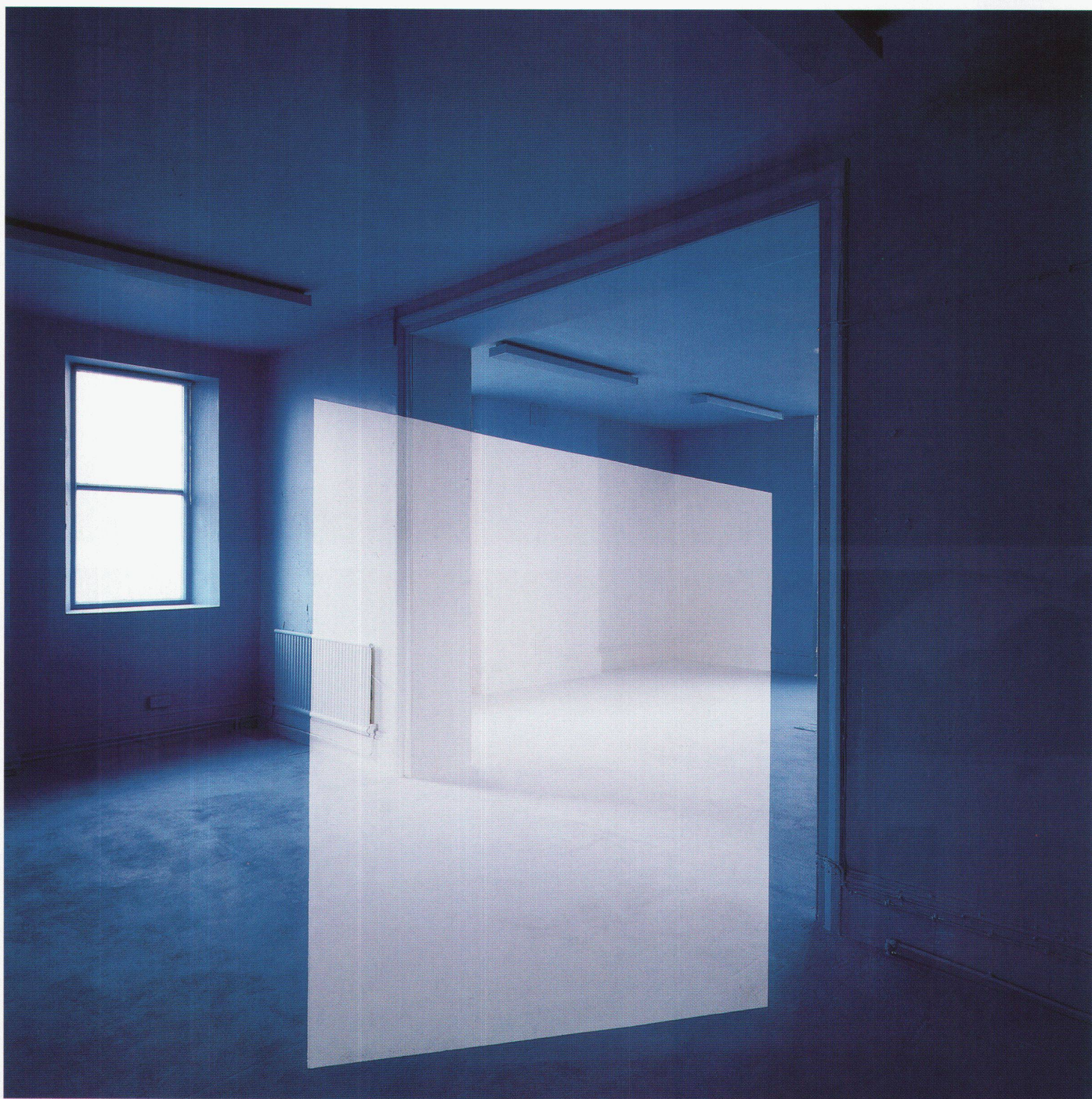
oben: Amherst, Guernsey, Ilfochrome auf Aluminium, 120 x 120 cm, Mai 1996 linke Seite: Chambre 304, C-Print auf Aluminium, 101 x 85 cm, 1984