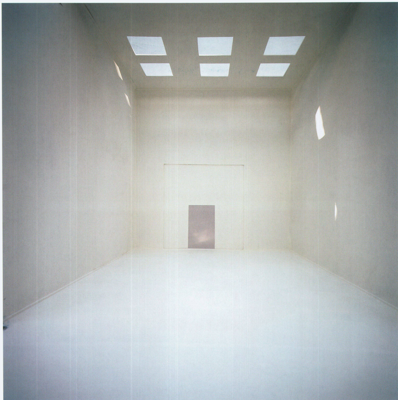
Room no 4, C-Print auf Aluminium, 130 x 128 cm, 1998