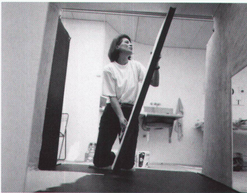
Atelier in London, 1998