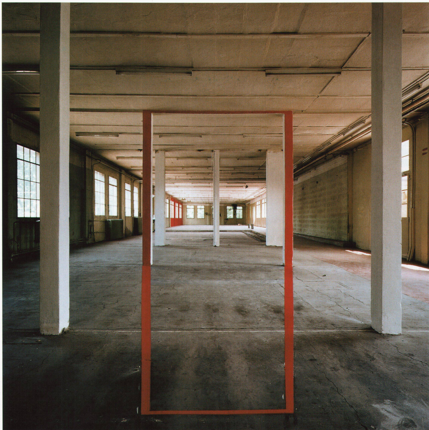
oben: Kugler, Ilfochrome auf Aluminium, 124 x 124 cm, April 1997