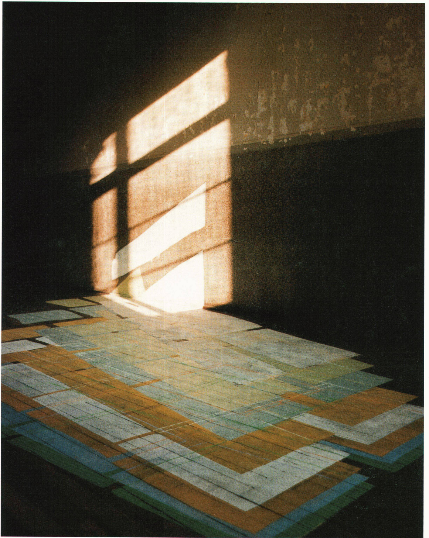
Le mouvement d'une fenêtre, C-Print auf Aluminium, 50 x 40 cm, Mai – September 1983