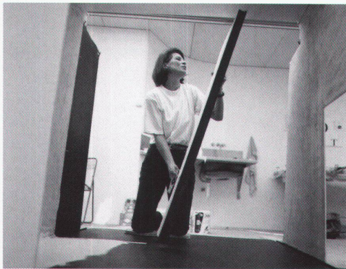
Atelier in London, 1998