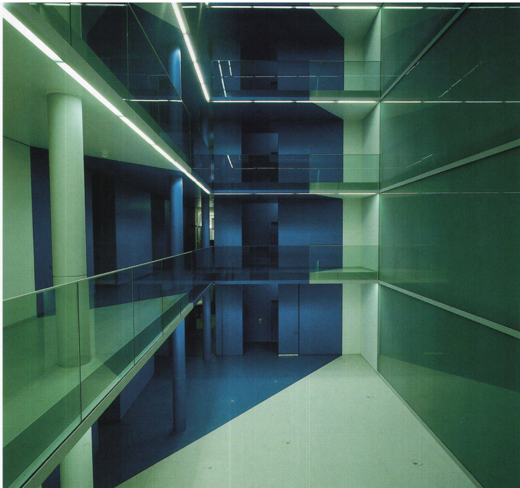
oben: Le champ bleu, Permanente Installation, Peter Merian Haus, Basel, 1999 linke Seite oben: Im Wasenboden, C-Print auf Aluminium, 100 x 105 cm, April 2002 linke Seite unten: Pré-Bois, C-Print auf Aluminium, 100 x 105 cm, 2002

Constructions photographiques Une approche des travaux d'Ursula Mumenthaler. L'artiste Ursula Mumenthaler, vivant et travaillant à Genève, réalise des photographies d'espaces dont elle modifie l'intérieur et l'entourage. Les situations obtenues ne sont pas, comme souvent supposé, travaillées et manipulées à l'ordinateur, mais leur spatialité fonctionne au travers du seul objectif photographique. On trouve par exemple des peintures de sol planes et déformées ou des photographies de paysage prises à travers une maquette en carton, où souvent, l'entourage n'est qu'un fragment de papier peint. Grâce à un réglage exact de l'objectif de la caméra, Mumenthaler crée des situations irritantes en trois dimensions qui simulent la réalité et sollicitent ainsi notre perception habituelle. Le texte aborde les différentes formes d'irritation par les images et décrit dans quelle mesure ces travaux sont porteurs d'un intérêt architectural. L'exemple final est présenté dans un tel contexte, à savoir la conception des couleurs dans l'une des cours intérieures de la Maison Peter Merian bâtie à Bâle par Hans Zwimpfer. ■