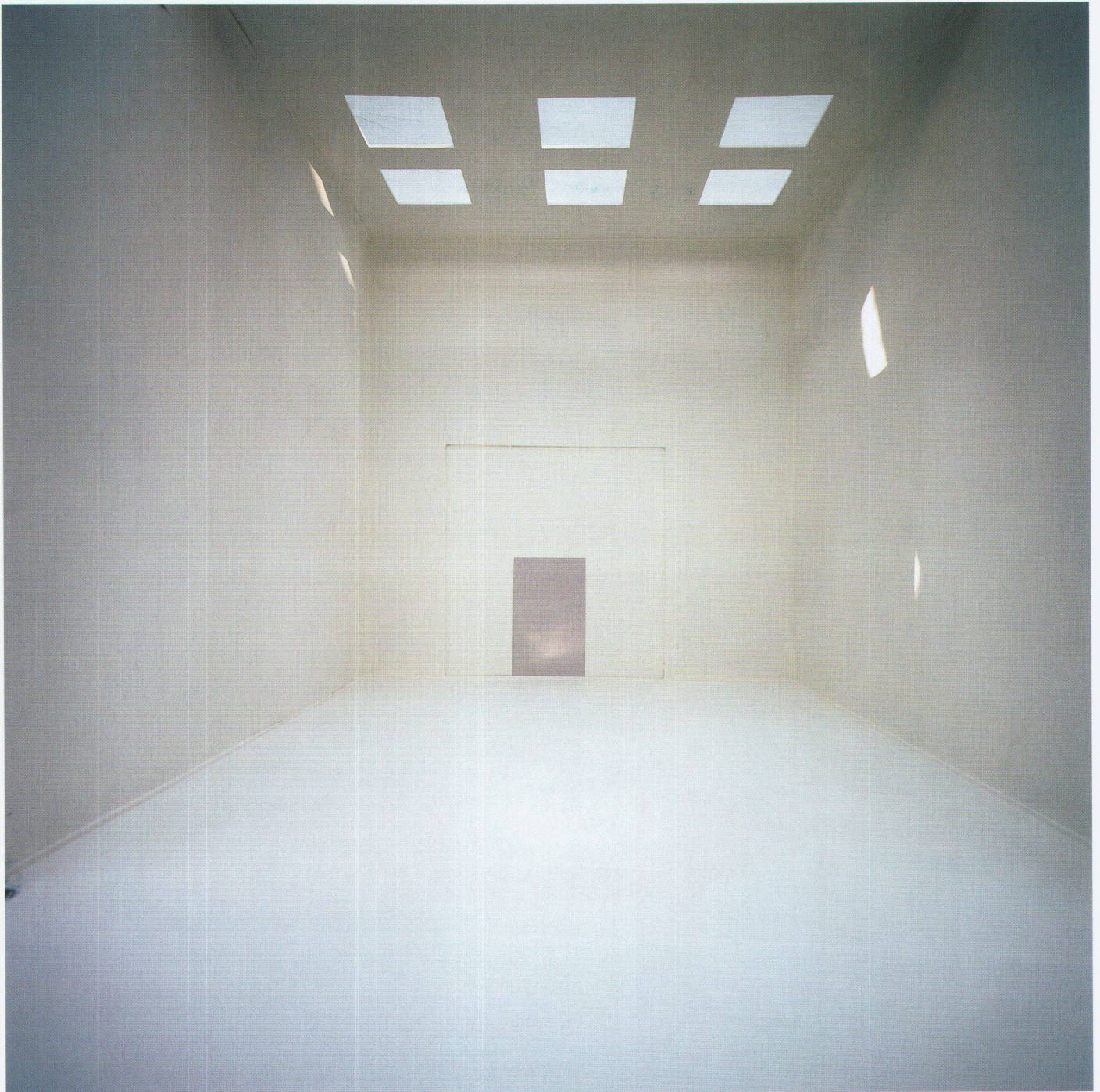
Room no 4, C-Print auf Aluminium, 130 x 128 cm, 1998