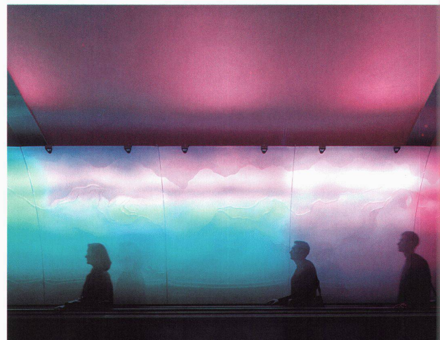
Förderband entlang der Glaswand