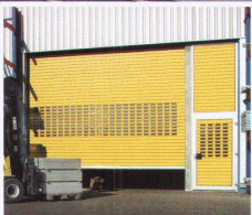
Hörmann Rolltore, jetzt auch als «Speed» Version