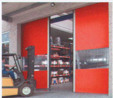
Schnellaufstore mit flexiblem Behang