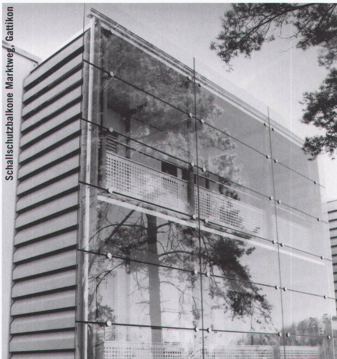
Schallschutzalkone Marktweg, Gattikon

Die einwöchigen Workshops des Centre International de Recherche et d'Education Culturelle et Agricole, seit 1996 in Zusammenarbeit mit dem Vitra Design Museum und dem Centre Georges Pompidou organisiert, finden vom 27. Juni bis 11. September 2004 im Domaine de Boisbuchet im Südwesten Frankreichs statt. Als Ergänzung zum Hochschulstudium als berufliche Weiterbildung konzipiert, liegt der Schwerpunkt der Seminare auf der praktisch-gestalterischen Arbeit und steht auch interessierten Laien offen. Vorträge und Diskussionen ergänzen das Programm, die Umgebung des Landgutes erlaubt Freizeitaktivitäten sportlicher wie kultureller Art. www.boisbuchet.com oder www.design-museum.de .