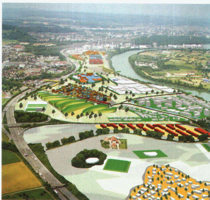
Studienuauftrag Salina Raurica, Pratteln und Augst, 2002

Dabei wählte die Metron bei ihrer Gründung ein zukunftsorientiertes und einzigartiges Firmenmodell. Unter dem Dach einer Holding