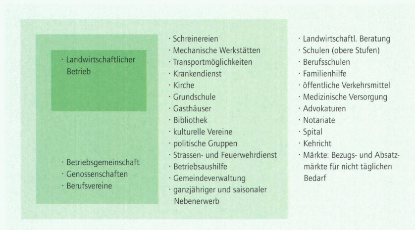
Abb. 1: Dorfmodell

Entscheidend für die Entwicklungen im Berggebiet sind aber nicht die Regierungsprogramme, sondern die Kräfte der allgemeinen wirtschaftlichen Entwicklung. Bei Hochkonjunktur können die Unternehmen mehr exportieren und es kommen mehr Touristen in die Alpen, die dortige Angebote nachfragen oder Ferienwohnungen kaufen. In Kenntnis dieser wirtschaftlichen Abhängigkeiten des Berggebietes besteht unser