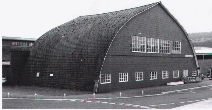
Bider-Hangar heute, Nordfassade