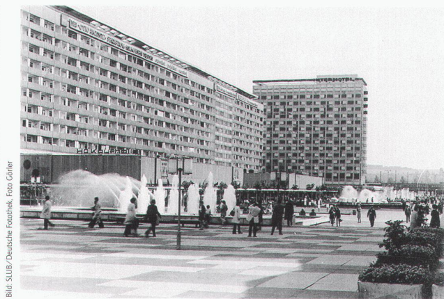
Dresden, Prager Strasse, Blick nach Norden, 1979