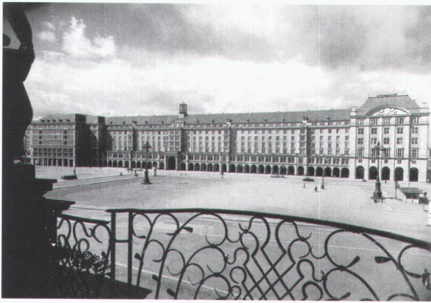
Dresden Altenmarkt Westseite, Gesamtansicht vom Konzert-Café, 1957