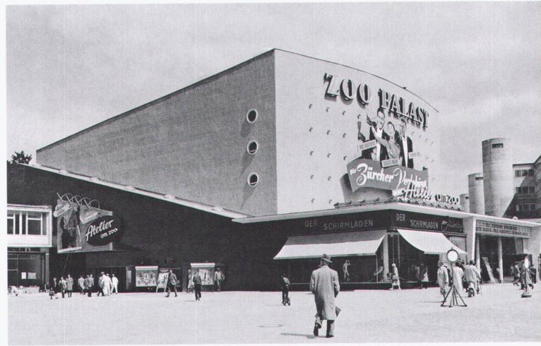
Kino «Zoo Palast» in Berlin-Charlottenburg, 1956–57, von Paul Schwebes, Hans Schoszberger und Gerhard Fritsche.