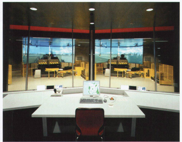
Luscher Architectes: Gebäude für Panzerhaubitzen-Schiesssimulatoren, Bière

üben hier auch Manipulationen am Äusseren der «Panzer», etwa das Starten des Generators, das Beladen mit Munition u.ä. Die Simulatoren gleichen daher amputierten Panzern, wobei die Umgebung über hochpräzise Digitalprojektoren als Panorama auf einen Rundschirm projiziert wird, der vor dem Gerät hängt wie die Karotte vor der Nase des Esels.