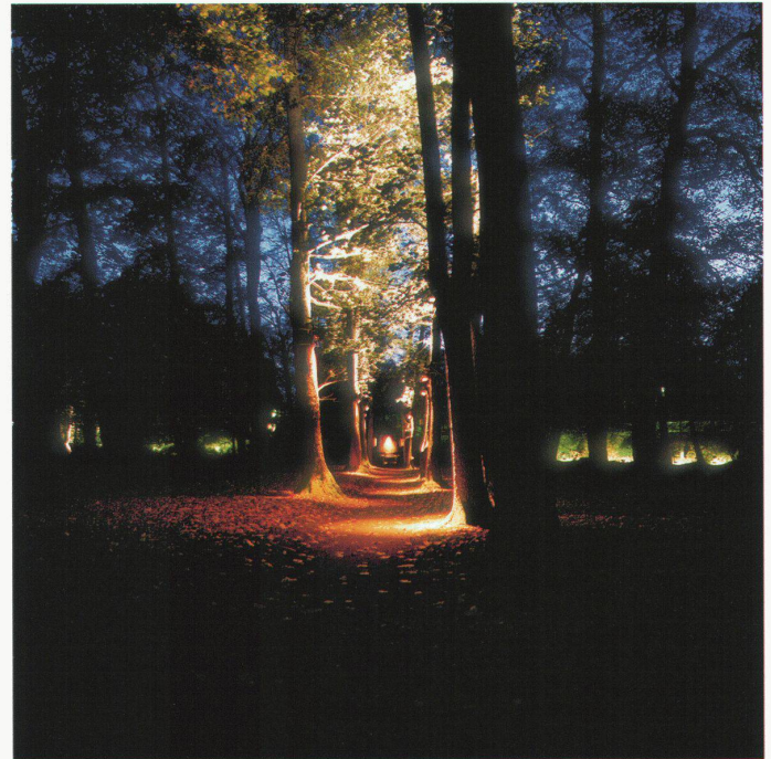
Der Park in Alingsås wurde ausschliesslich mit weissem Licht bearbeitet. Natürliche Farben sind reichlich vorhanden. Der Parkraum wird im Hintergrund durch Kompaktleuchtstofflampen definiert. Die Downlights in den Bäumen besitzen warmweisse Lichtquellen. Die Uplights tageslichtweisses Licht. Workshop 2001 in Alingsås, Leitung: Torbjörn Eliasson.