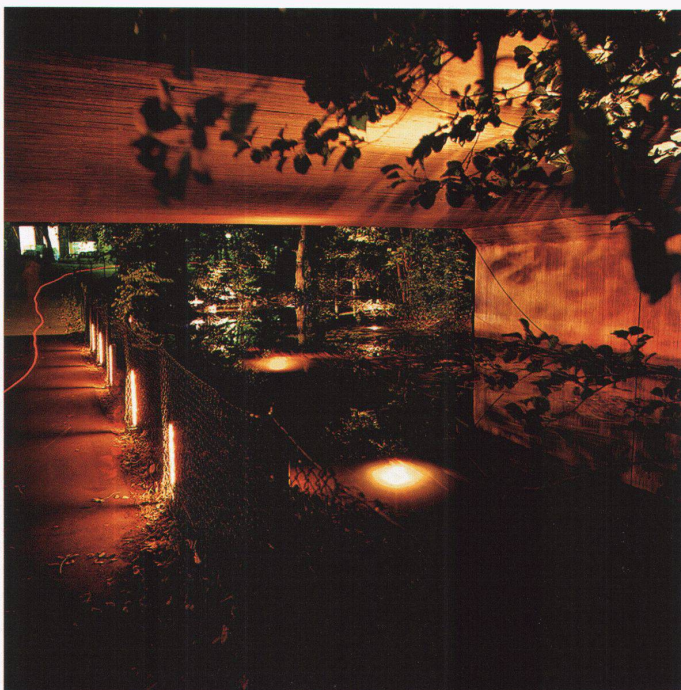
Alingsås. Alternative Beleuchtung von Bahnunterführungen. ELDA+ Workshop 2002 in Alingsås, Leitung: Tapio Rosenius.