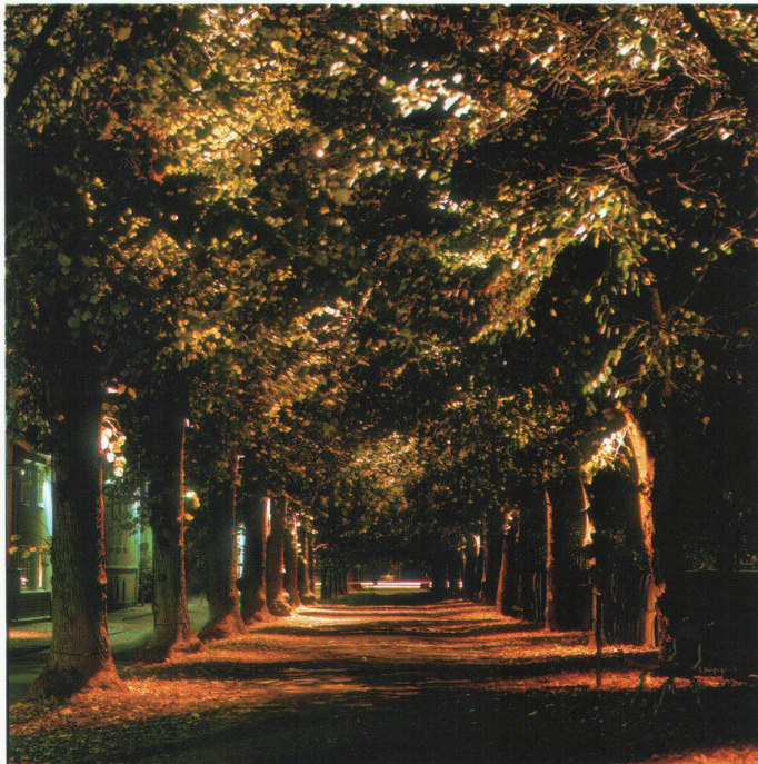
Alingsås . Beleuchtung kann auch ästhetisch sein. Am linken Bildrand die herkömmliche Strassenbeleuchtung, rechts die Beleuchtung einer Allee, die am Friedhof entlang führt. Workshop 2001 in Alingsås, Leitung: Kai Piippo.

hinaus gilt es bei der Gestaltung des beleuchteten öffentlichen Raums auch den jeweils adäquaten Ausstrahlwinkel zu definieren. Zur Akzentuierung von Baudenkmälern oder anderen architektonischen Elementen gibt es Leuchten mit Ausstrahlungswinkeln ab vier Grad. Breitstrahlende Leuchten weisen Winkel über 40 Grad auf und werden auch als Fluter bezeichnet. Die Lichtkegel können in diesem Zusammenhang kreisförmig und damit symmetrisch oder aber auf den Durchmesser bezogen asymmetrisch sein. Diese Form wird insbesondere bei Bodeneinbaustrahlern verwendet, die Fassaden beleuchten und den direkten Streuverlust in den Himmel reduzieren sollen. Damit sei auch das Thema der Lichtverschmutzung angesprochen, ein Begriff, der häufig falsch verwendet und verstanden wird: Die Beleuchtung von Fassaden ist noch keine Lichtverschmutzung. Lichtverschmutzung ist die übermäßige sinn- und orientierungslose Beleuchtung ohne Reflektionsflächen. Der klare Nachthimmel reflektiert nicht. Was im Himmel als Beleuchtung zu erkennen ist, sind ausschliesslich Lichtreflexionen an Gasen wie Nebel, Dampf oder Rauch. Die Lichtverschmutzung ist deshalb nicht anhand von Uplights oder Downlights, sondern überwiegend nach den vorhandenen Reflektionsflächen zu bewerten. Nicht das Lichtdesign ist für Lichtverschmutzung ausschlagge-