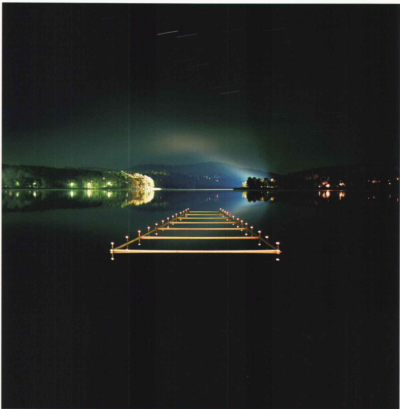
Alingsås (Schweden). Raumdefinition durch Hinterleuchtung. Der See liegt normalerweise in der Dunkelheit. Durch die Hinterleuchtung werden Grenzen sichtbar. Die Installation auf dem Wasser sind lediglich Abwasserrohre, die durch 2 x 35 Watt beleuchtet werden. Workshop 2002 in Alingsås, Leitung: Prof. Jan Ejhed und Anders Vinell.