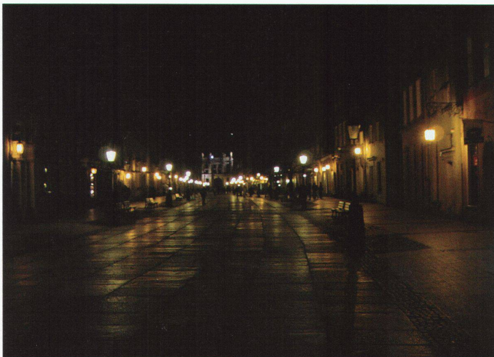
Danzig, Stadtbeleuchtung heute, aber wo ist die Stadt? Eine ausschliesslich technische Betrachtung des Stadtlisches reicht nicht, um alle Funktionen der Beleuchtung abzudecken. Minimierte Beleuchtung bedeutet zwar Energieeinsparung, fördert aber Unbehagen und Ängste.

Le développement durable est aussi un thème important dans le domaine de l'éclairage. Le développement durable