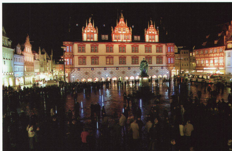
Coburg. Raumdefinition durch Fassadenbeleuchtung: Die FH Coburg hat unter der Leitung von Prof. Uwe Belzner einen Stadtraum gestaltet, in dem die Mastleuchten ausgeschaltet wurden. Allein die Fassadenbeleuchtung bewirkt die Raumatmosfera.