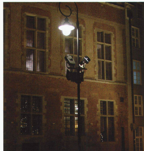
Danzig. Historische Leuchten mit modernem Appendix sind das Ergebnis unsensibler technischer Planung.