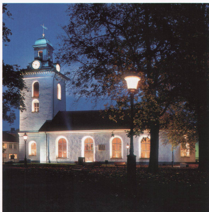
Die Kirche in Alingsås wurde äusserst sensibel gestaltet. Eine dezente Grundbeleuchtung der Fassade wurde ergänzt durch eine Akzentuierung der Fenster, die eine Tiefe bewirkt. Der Turm wurde durch blaues Licht hervorgehoben. Gewöhnlich ist die Kirche mit Natriumdampflampen flächig beleuchtet (Bild oben). Workshop 2000 in Alingsås, Leitung: Roope Siirainen.