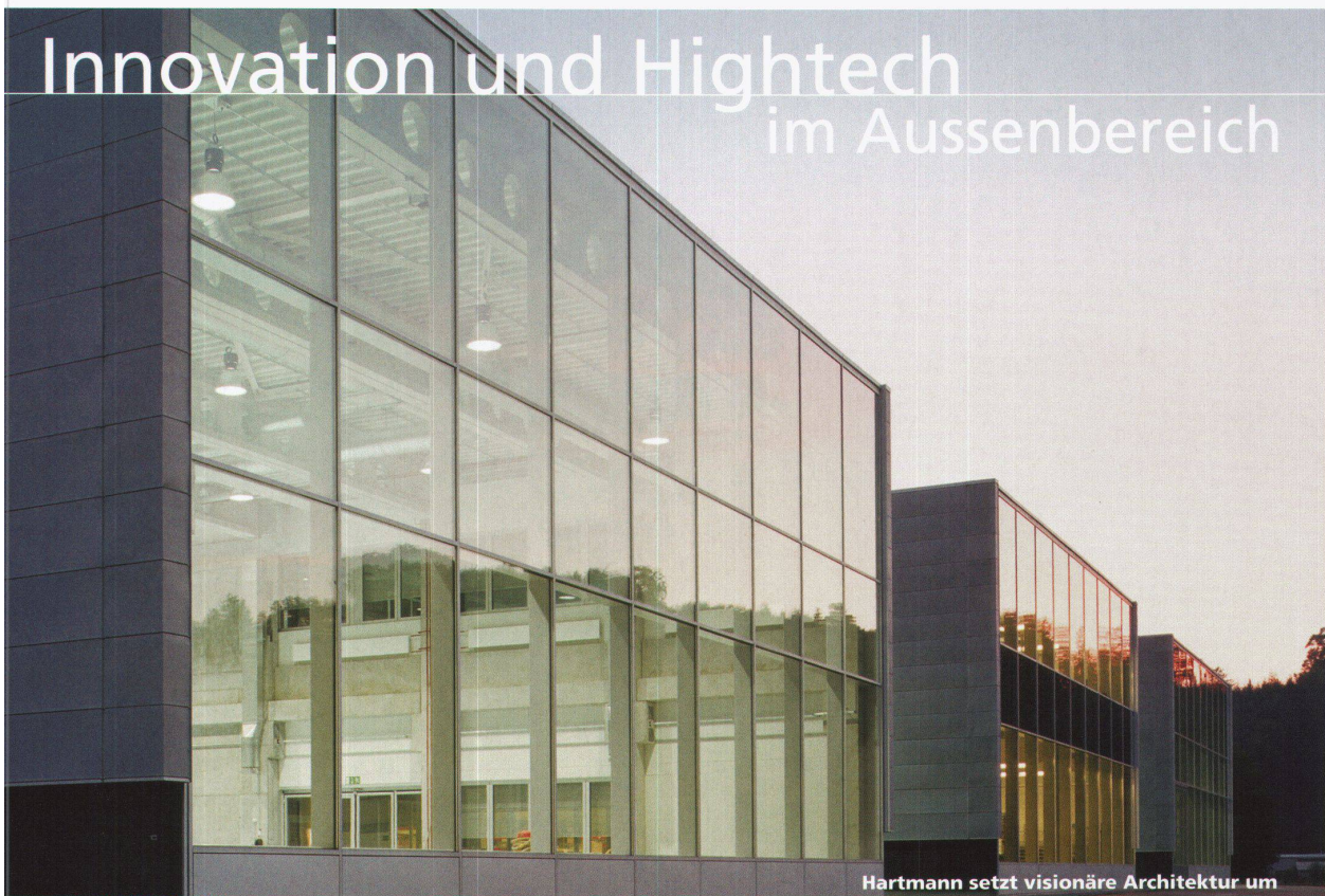
Hartmann setzt visionäre Architektur um