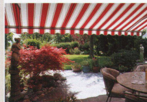
Hartmann bietet Lebensqualität Sonnens- und Wetterschutz