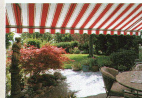
Hartmann bietet Lebensqualität Sonnens- und Wetterschutz