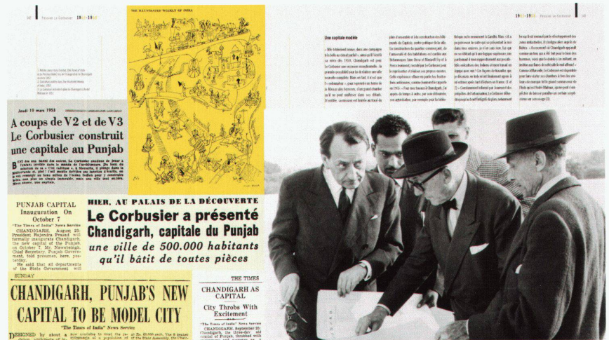
Buchumschlag und Innenseiten, Le Corbusier in Milano, 1951