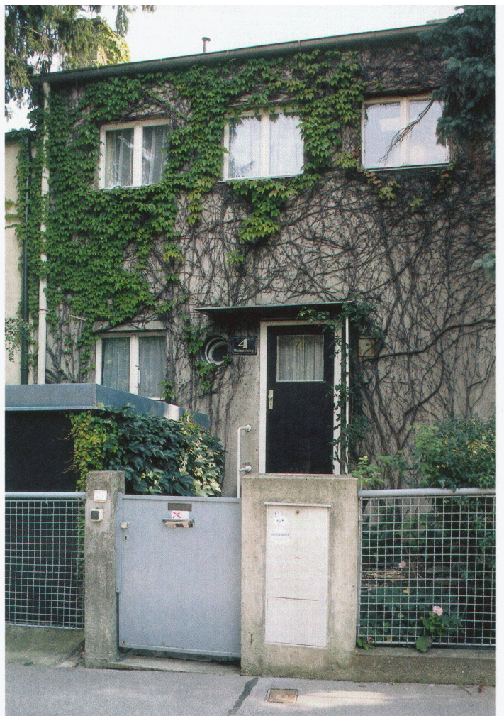
Linke Seite: Über die Zeit individuell gestaltete Reihenhaussiedlung in Canterbury

Muss noch darauf hingewiesen werden, dass dieser Wandel in der Zeit auch das Miteinander von alter und neuer Architektur bedeutet? Ebenso, wie in einer alten Stadt ein Neubau in alten Strukturen und Nutzungen Fortsetzung und neue Perspektive verspricht, so kann auch in gewaltigen Neubaukomplexen die Präsenz eines Altbaus, der durchaus nicht Baudenkmal