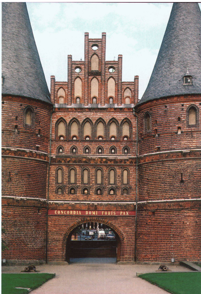
Linke Seite: Holstentor in Lübeck, 15. Jh.