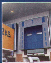
Industrie-Sectionaltor mit Ladebrücke und Torabdichtung

Der bietet Ihnen zum Beispiel die neuen, besonders sicheren und wirtschaftlichen SoftEdge-Tore mit integriertem Anti-Crash-/Anfahrerschutz. Dazu Ladebrücken, Torabdichtungen, Vorsatzschleusen und Industrietore – alles aus einer Hand, perfekt auf- einander abgestimmt.