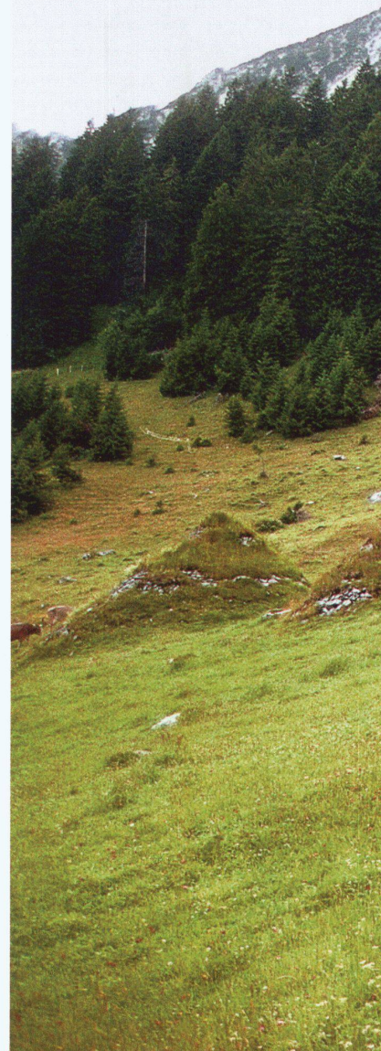
Bremshöcker in Amden

In der Zeit vom 17. bis zum 19. Jahrhundert nahm die Bevölkerung im Gebiet der Alpen stark zu. Immer mehr und exponiertere Gebiete in den Bergen mussten zur Sicherung der Existenz besiedelt und als Kulturland nutzbar gemacht werden. Zwar versuchten die Menschen, ihre Bauten soweit als möglich an Orten zu platzieren, an denen keine Gefährdung durch Naturgewalten zu erwarten war. Zunehmend wurden jedoch die schützenden Waldflächen abgeholzt, um Holz als Brennmaterial und Rohstoff zum Verkauf zu gewinnen. Als Folge davon waren Gebäude, Weiden und Felder von Lawinen, Steinschlag und Hochwasser