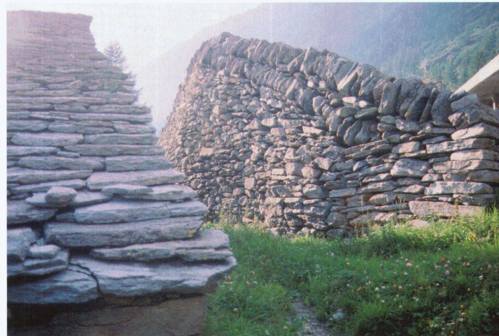
Oben: Spaldecke am Simplon. Unten: Lawinen-Terrassen auf der Alp Faldum