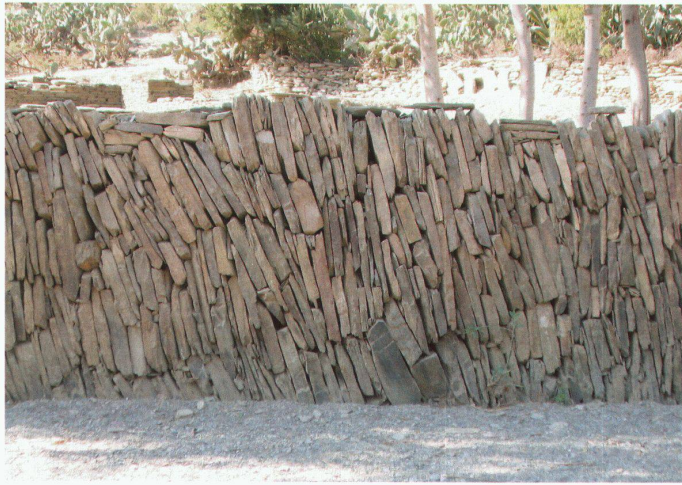
Schutzmauern in Äthiopien

gefährdet. Trotz diesen schwierigen Bedingungen hat man versucht, sich möglichst gut vor den Naturgefahren zu schützen. Mit einfachsten Werkzeugen und dem jeweils direkt am Ort abgebauten, dauerhaften Gestein wurden Schutzbauwerke errichtet, deren Grösse und Konstruktion erstaunlich ist.