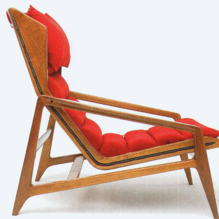
Sessel von Gio Ponti