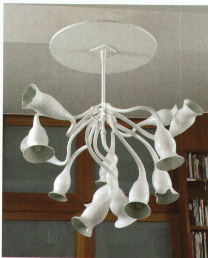
Leuchten von Jeff Zimmermann und Wendell Castle