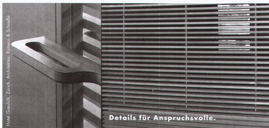
Hotel Greulich, Zürich, Architekten: Romero & Schaeffle