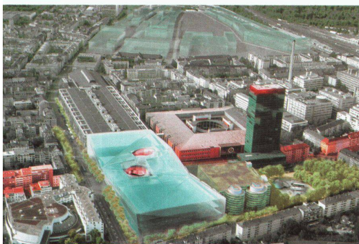
Die Basler Messe heute (oben) und im Jahr 2012 (unten)