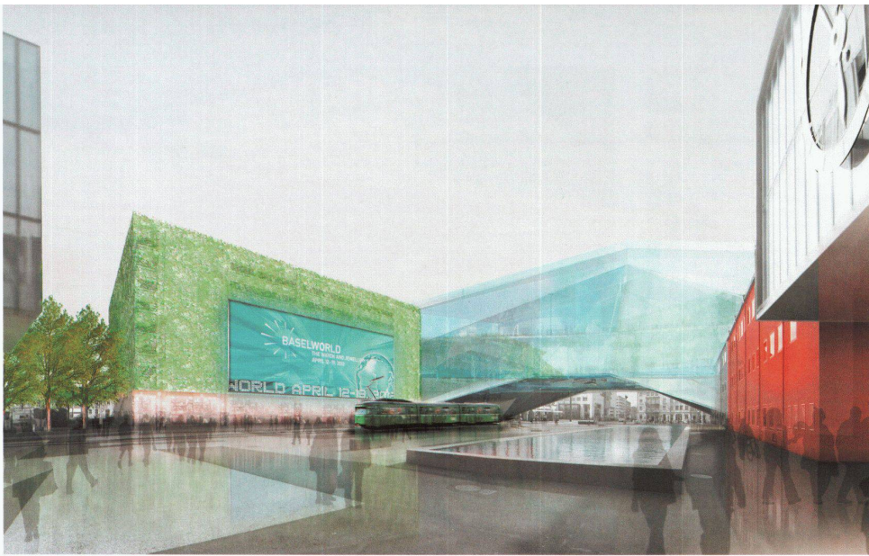
Bilder: Herzog & de Meuron / MCH Messe Schweiz (Holding) AG