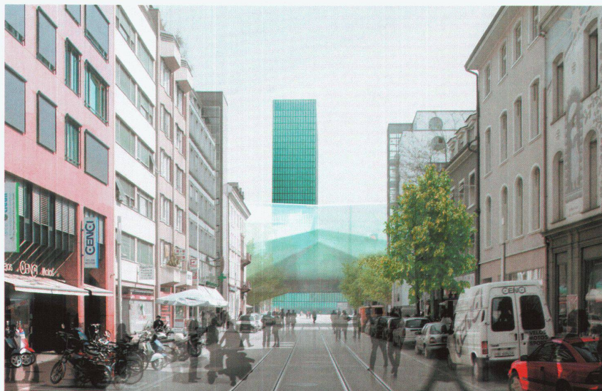
Achse Clarastrasse – Messeturm

Uhren- und Schmuckmesse Baselworld bespielt werden, anderweitig Ersatz gefunden werden. Auf dem DB-Güterbahnareal wird dann eine weitere Etappe des neuen Quartiers und Parks «Erlenmatt» realisiert werden. Dass dieses Areal in unmittelbarer Nähe zur Messe und zur Autobahn nicht als modernes Gewerbegebiet mit zahlreichen Optionen entwickelt wurde, spricht von einem eigenen Kapitel der jüngeren Basler Stadtplanungsgeschichte. So stellt sich also erneut die Aufgabe, die begrenzten Ressourcen auf dem angestammten Messeareal noch besser auszunutzen.