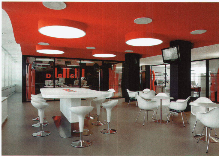
Besprechungszone «Marktplatz» mit Radiostudio von DRS1 im Hintergrund