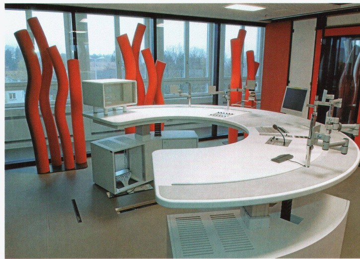
Hauptradiostudio von DRS1 im Zürcher Max Bill Hochhaus

akustische Absorption zu verbinden. Das Radiostudio hat zwei Kriterien zu erfüllen: Es muss schalldicht sein und gute Klangqualität bieten, was in diesem Fall heisst, dass der Raum als solcher nicht hörbar sein soll.