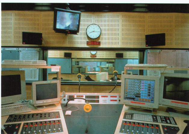
Regieraum von Radio DRS in Zürich von 1993

In einem Radiostudio muss man die Raumakustik von allen Seiten behandeln. In anderen Räumen befinden sich die Schall absorbierenden Elemente meist nur in der Decke, in einem Studio in Decke, Wänden und Boden. So galt es für Architekt und Akustiker, optische Transparenz und