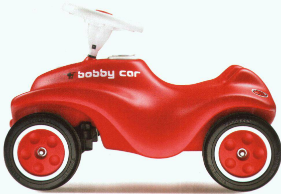
Nach dem sanften Redesign des Bobby-Car läuft der Klassiker deutlich ruhiger, aber nicht völlig geräuschlos.