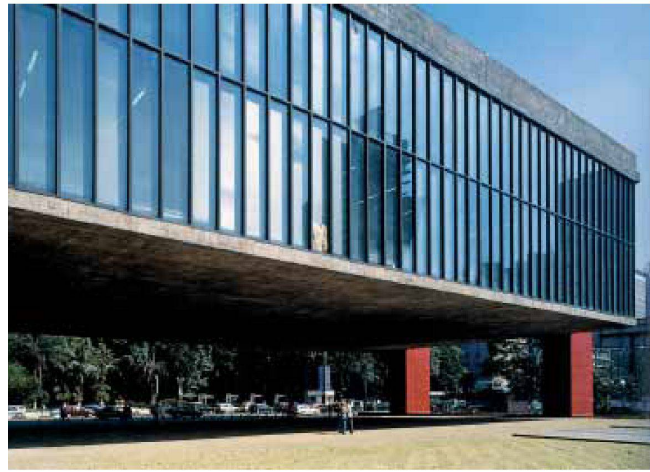
MASP – Museu de Arte de São Paulo, 1968