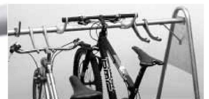
Das Lenkerhaltesystem für Ordnung und guten, schonenden Halt der Fahrräder.

Ihr servicestarker Partner mit innovativen Lösungen: