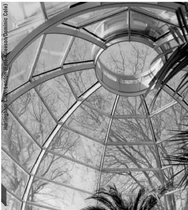
Hurlingham Club, London

Der 1921 geborene Genfer Architekt André Gaillard hat mit einer Reihe bemerkenswerter Bauten namentlich in den 1960er und 70er Jahren die Stadt Genf geprägt (vgl. den Beitrag über das CICG in diesem Heft). Die Broschüre publiziert ein aufschlussreiches Podiumsgespräch verschiedener Architekten, die sich aus heutiger Sicht über ihr Verhältnis zum Werk Gaillards äussern. Eine Auswahl von dreizehn mit Plänen und Fotos illustrierten Bauten des Büros Gaillard, vom Einfamilienhaus über den Wohnungsbau bis zu öffentlichen Bauten und Gebäuden für die Vereinten Nationen, bieten einen interessanten Einblick in Gaillards vielfältige und doch konsequente Arbeit. Eine erschöpfende Liste von Projekten und Realisierungen in Genf sowie eine nützliche Bibliographie beschliessen das Heft. Es ist das zweite einer Reihe kleiner Monographien, welche die Genfer Sektion des BSA über Genfer Architekten herausgibt. Die erste Nummer über François Maurice & Associés erschien 2003. Es bleibt zu wünschen, dass die Reihe in zügigerem Rhythmus weitergeführt wird und dass ihr eine ISBN-Nr. den Weg in den Buchhandel öffnet (Bestellungen: Mitglieder BSA an bassi@bassicarella.ch , übrige an die Librairie Archigraphy, archigraphy@capp.ch ). nc