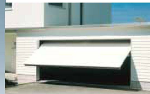
Hartmann öffnet Ihnen Tür und Tor: automatische Garagentore