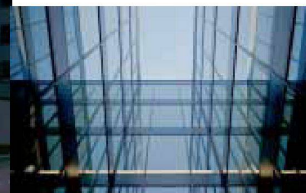
Hartmann setzt visionäre Architektur um: Fassadenbau