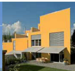
Hartmann bietet Lebensqualität: Sonnen- und Wetterschutz