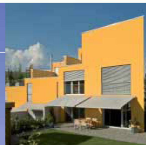
Hartmann bietet Lebensqualität: Sonnen- und Wetterschutz