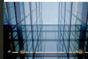
Hartmann setzt visionäre Architektur um: Fassadenbau