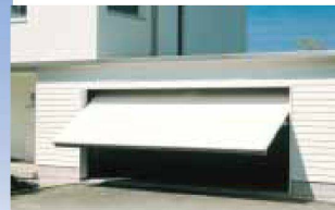
Hartmann öffnet Ihnen Tür und Tor: automatische Garagentore