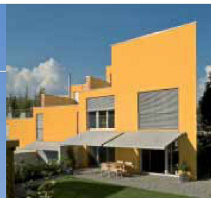
Hartmann bietet Lebensqualität: Sonnen- und Wetterschutz