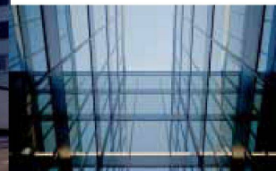
Hartmann setzt visionäre Architektur um: Fassadenbau

Hartmann ist immer für Sie da: auch bei Service und Reparaturen