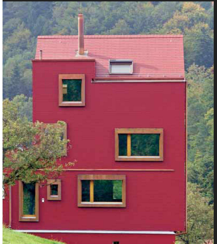
Architekt: Hubert Bischoff , Wölfthalen Dach: DACHSCHIEFER Fassade: FASSADENSCHIEFER

Seit Dezember 2006 sind fünf neue Bände der De aedibus-Reihe erschienen, drei weitere über Enzmann + Fischer, Brauen + Wälchli sowie Mierta und Kurt Lazzarini werden bei Erscheinen dieses Heftes ebenfalls vorliegen. Konsequenter demselben Raster folgend – neben Vorwort des Verlegers, Hans Wirz, und einem einführenden Beitrag eines Architekturkritikers werden einige Bauten des jeweiligen Architekturbüros ausführlich dokumentiert – umfasst die Reihe nun 21 Bände. Ein Marschhalt für die sich präsentierenden Architekturbüros, um ihre bisherige Arbeit aus etwas Distanz zu betrachten, über ihren Arbeitsprozess und die Entwicklung ihrer eigenen Handschrift nachzudenken. Für den Leser, ob Berufskollege oder interessierter Laie, bieten diese Publikationen Gelegenheit, das zeitgenössische Bauen in der Schweiz, im städtischen wie ländlichen Umfeld und mittelweile bald über zwei Generationen zu verfolgen. Allein schon aus diesem Grund ist dieser Buchreihe ein langes Leben zu wünschen, ihr schlichtes, einheitliches und sorgfältig komponiertes Erscheinungsbild vermag aber auch den Blick für qualitativ volles Bauen zu schärfen. rh