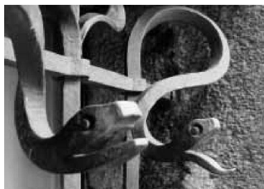
Oben: Lichthof als Sockelbau des Amtshauses III an der Strassenrampe. Unten: Kellerwächter am Amtshaus III