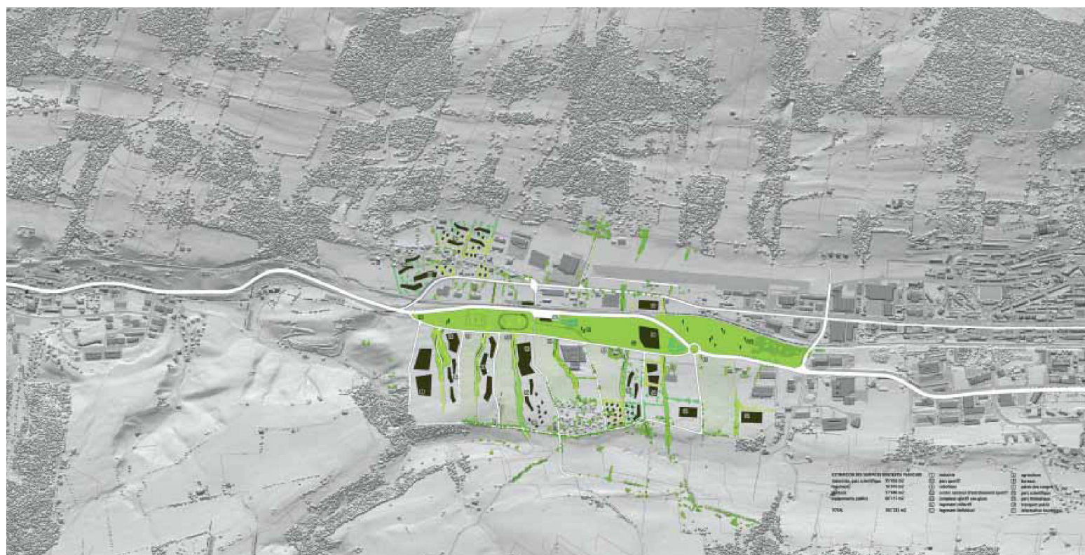
2. Preis: «rhizome», Véronique Favre, architecte, Genève