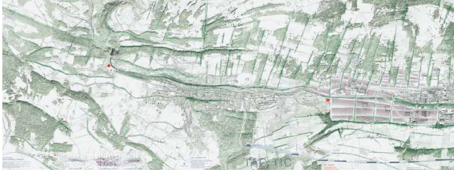
3. Preis: «tac tico», Paysagestion SA, Lausanne

Bauherrschaft zur Vertiefung empfohlen hat, entstand aus der Zusammenarbeit der beiden Büros Tanari Architectes et Urbanistes, Thônex-Genève, und JL+CH Thibaud Zingg SA, Yverdon-les-Bains. Das Hauptanliegen dieses Projektes offenbart sich am augenfälligsten in den Schnitten: