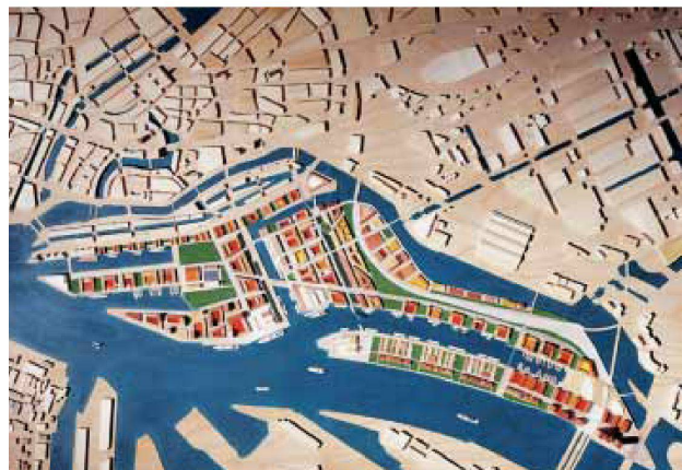
Oben: Kontorviertel, Hamburg.